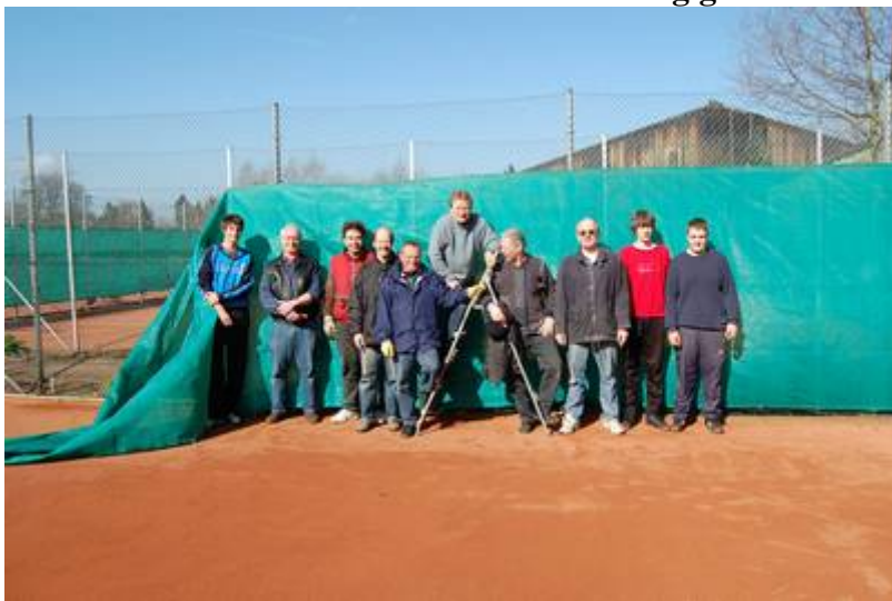
Nach getaner Arbeit stellt sich die Gruppe dem Fotografen