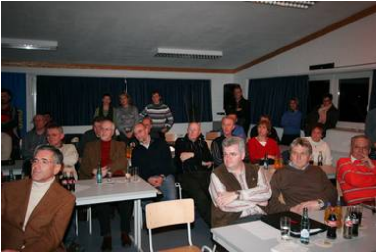
Gespannt lauschen alle den Ausführungen der Radsportler