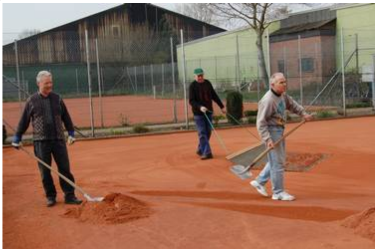
Jede Hand wird bei der Platzvorbereitung gebraucht

Damit Tennis Spaß macht, ist ein guter Platz Voraussetzung. Dafür sorgen die Mitglieder der Tennisabteilung im April. Für sie kann die Saison mit vielen Matches kommen.