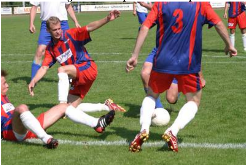
Da stehen seine Schützlinge in nichts nach