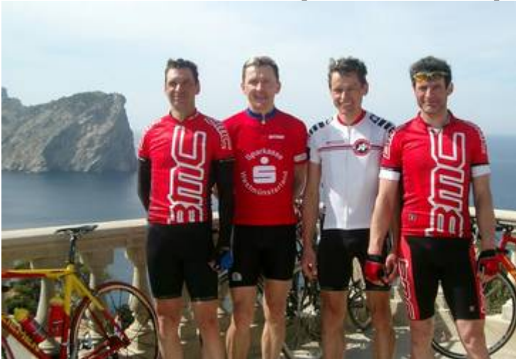
Die SG-ler am Cap Formentor

Die Trainingsetappen gestalteten sich von flach über wellig bis hin zu sehr bergigem Terrain sehr anspruchsvoll. Die Königsetappe führte die Sportler mit 230 km von Arenal bis an die nordöstlichste Spitze der Insel, dem Cap Formentor.