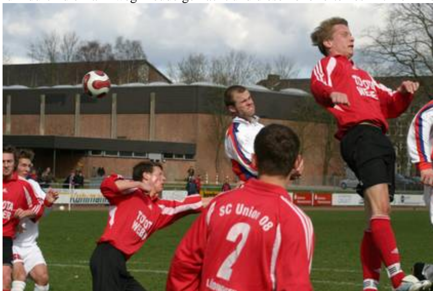
Im Luftkampf Olbing gegen alle

Platz 5 zum Ende der Saison wäre gut und entspräche auch der Zielsetzung vor der Saison. Im Übrigen muss man aber durchaus positiv feststellen, dass sich die Mannschaft im Vergleich zum letzten Jahr ganz erheblich verbessert und durch die guten Neuzugänge aus der eigenen Jugend und von auswärts sehr an Qualität gewonnen hat. Sie haben dem Publikum durch die Bank weg Freude gemacht und diese honorierten es mit mehr Zulauf.