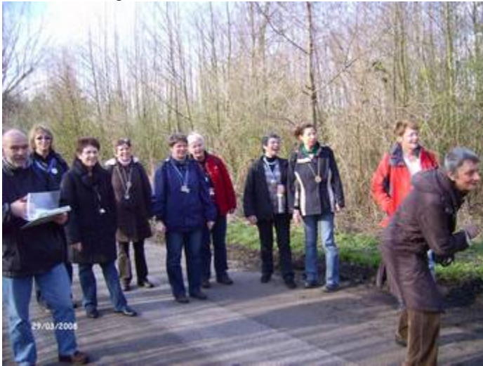
Stets mit Eifer bei der Sache: die Trimmerinnen beim Boßeln

Asyl wurde den fitten Sportlerinnen am Rastplatz der Nachbarschaft „Welmeringshook“ gewährt, wo sie eine kleine Pause einlegten, bevor sie den Abend gemütlich bei einem gemeinsamen Essen ausklingen ließen.