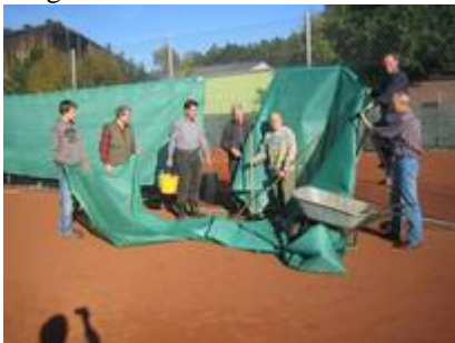
Aufräumen an der Tennisanlage

Der Dank des Vorstandes gilt diesen Mitgliedern.