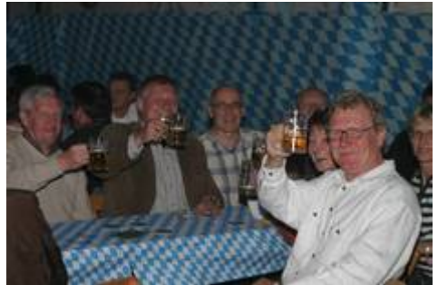
Stimmung beim Oktoberfest: Die Vierte