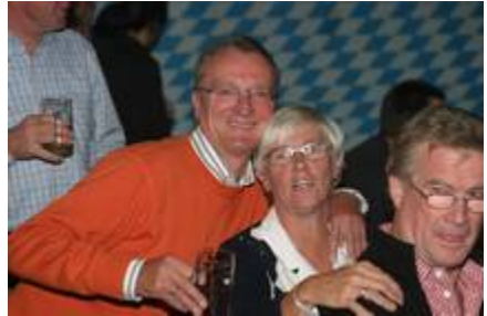
Stimmung beim Oktoberfest: Die Zweite