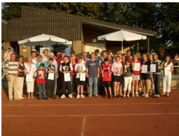
Alle Teilnehmer stellten sich nach den Wettkämpfen dem Fotografen