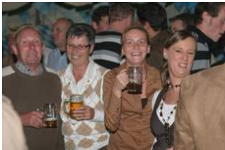
Stimmung beim Oktoberfest: Die Dritte