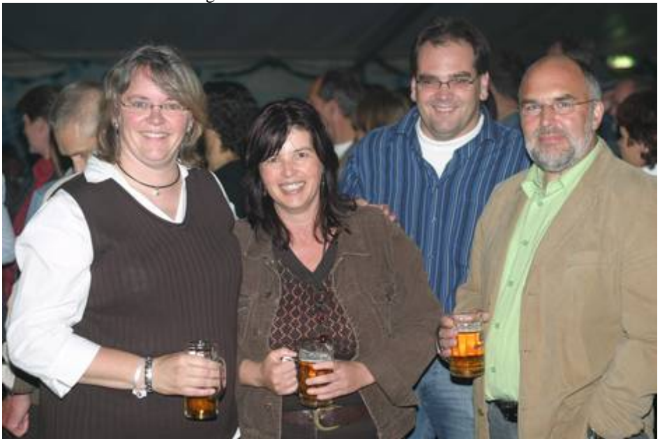
Gute Stimmung auf und neben der Tanzfläche