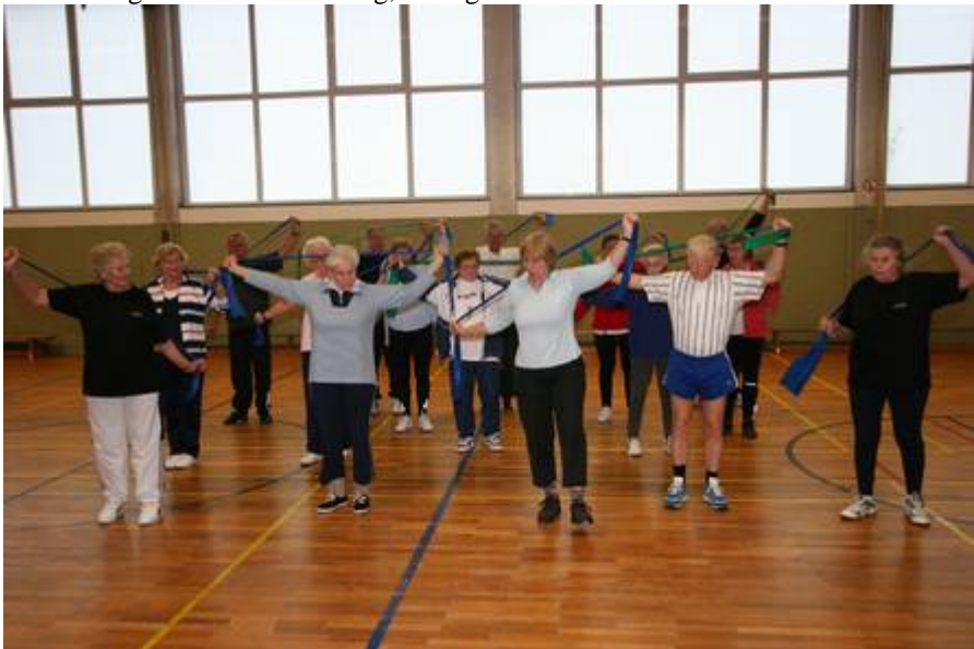
Bewegung mit dem Theraband gehört mit zum Repertoire der Gruppe