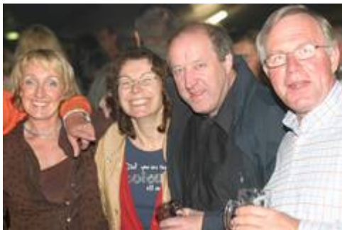
Stimmung beim Oktoberfest: Die Fünfte