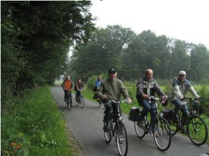
Auf den Fietzen durch die Münsterländer Parklandschaft