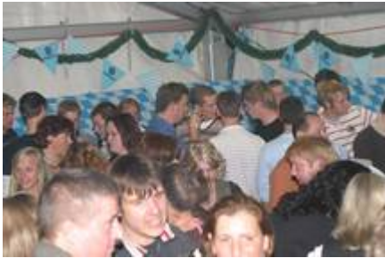
Stimmung beim Oktoberfest: Die Erste