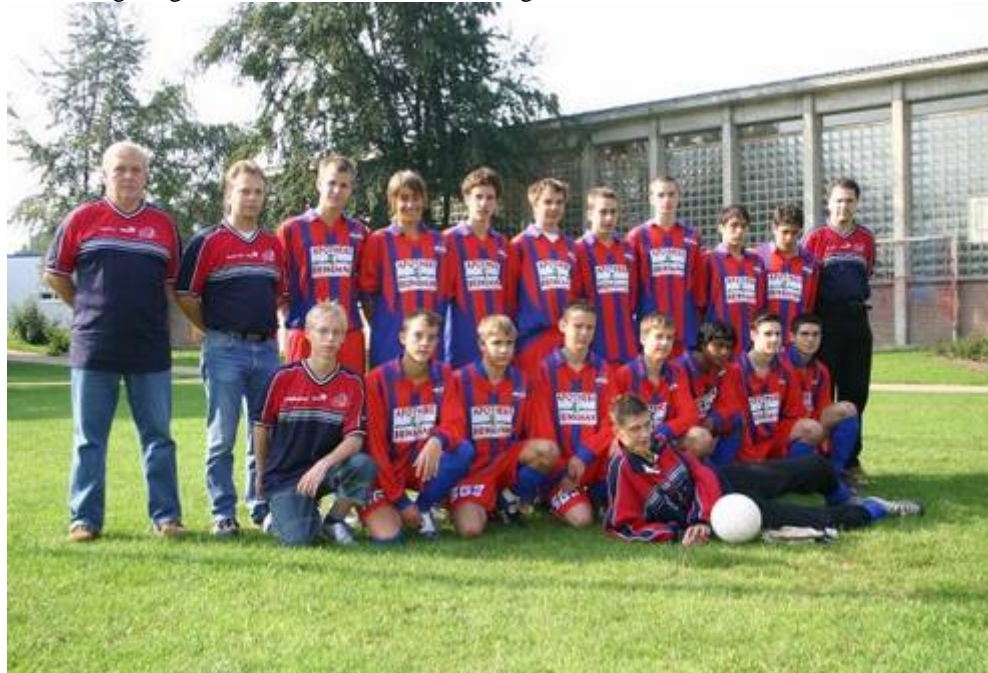
Die erfolgreiche B-Jugend Mannschaft

In der Aufstiegsrunde will die SG nun eine gute Rolle spielen. Ob es am Ende zum Aufstieg in die A-Kreisliga reicht, bleibt abzuwarten. Da in dieser Gruppe nur der Erstplatzierte sicher aufsteigt, wird man mit Sicherheit auch den Fußballgott auf seiner Seite haben müssen. Qualität hat die Mannschaft allemal. Wenn man von größeren Verletzungssorgen verschont bleibt, ist alles möglich.