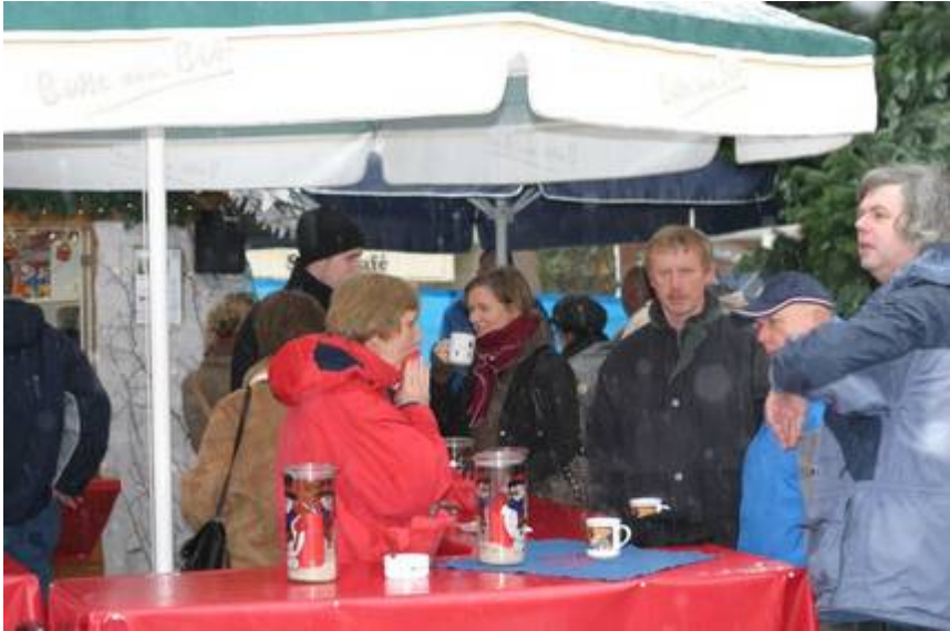
Gut besucht waren die Stände am Sonntag