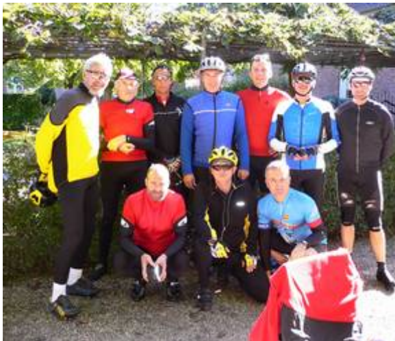
Mitglieder der Abteilung Radsport bei ihrem „Ausritt“

Diese nehmen wir zum Anlass, unsere Bezüge zur SG Borken zu intensivieren und die Nähe zum Hauptverein zu suchen, um auf dieser Grundlage in der Abteilung einen weiteren Ausbau der Aktivitäten zu erreichen. Sichtbares Zeichen dafür soll u.a. sein, dass wir unseren Treffpunkt vom Parkplatz am Döringbach zum Vereinsheim der SG Borken verlagern. Auch wird es innerhalb der Radsportabteilung personelle und strukturelle Veränderungen geben, um den „Neuanfang“ und den „Generationswechsel auf Raten“ zu dokumentieren. Der Radsport wird im Jahr 2006 im Vereinsleben der SG Borken mehr Präsenz zeigen.