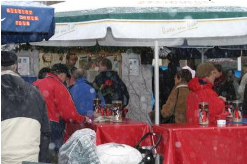
Schneetreiben hielt die Besucher nicht ab