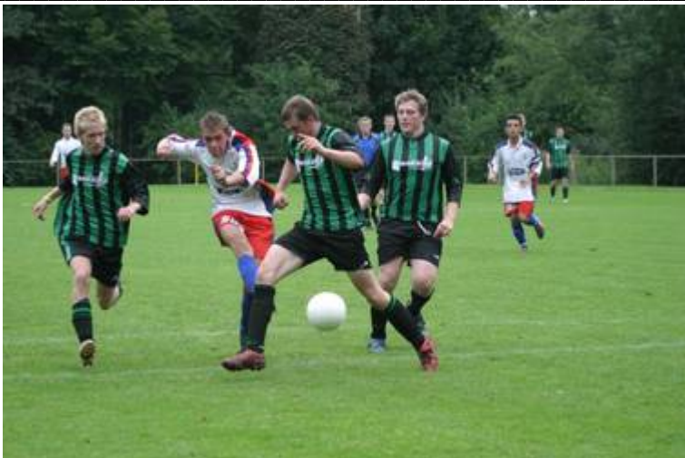
Tolle Szenen gibt es auch im Jugendfußball (hier: A-Jgd gegen Burlo)

Für die Endrunde im Feldkreispokal qualifizierte sich die F1 problemlos. Am 21.05.2005 galt es in dieser Gruppenerster zu werden, um so das Halbfinale zu erreichen. Nach Siegen gegen GW Erkenschwick und SG Suderwich genügte zum Abschluss ein Unentschieden gegen BVH Dorsten zum Gruppensieg. Im Halbfinale schlug unser Team den VfL Drewer 1:0. Im Endspiel war wiederum Westf. Gr.Reken der Gegner. Hier behielten wir mit 2:0 sicher die Oberhand